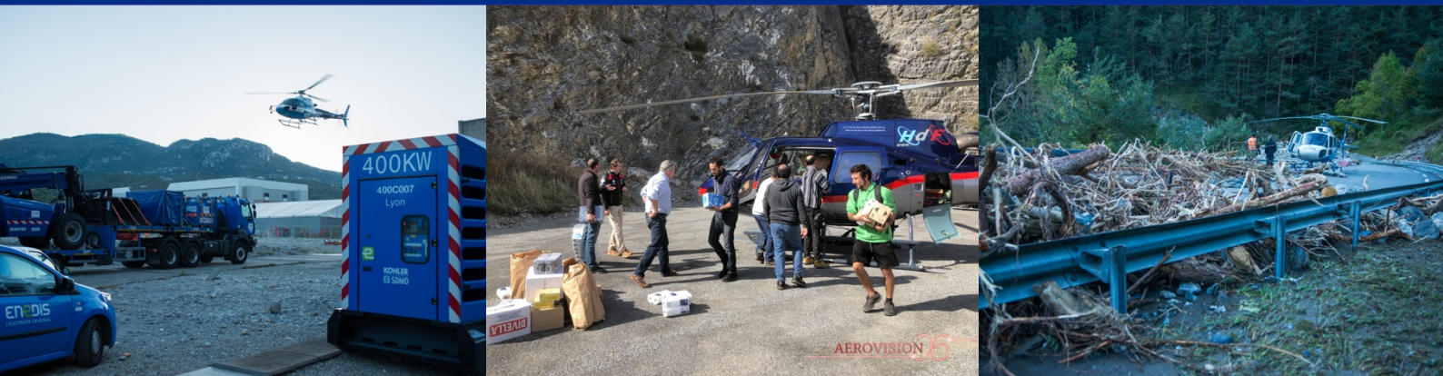
Tempête Alex - Les hélicoptères de RTE et Hélicoptère de France en soutien

DÉFENSE ET PROMOTION DU SECTEUR HÉLICOPTÈRE